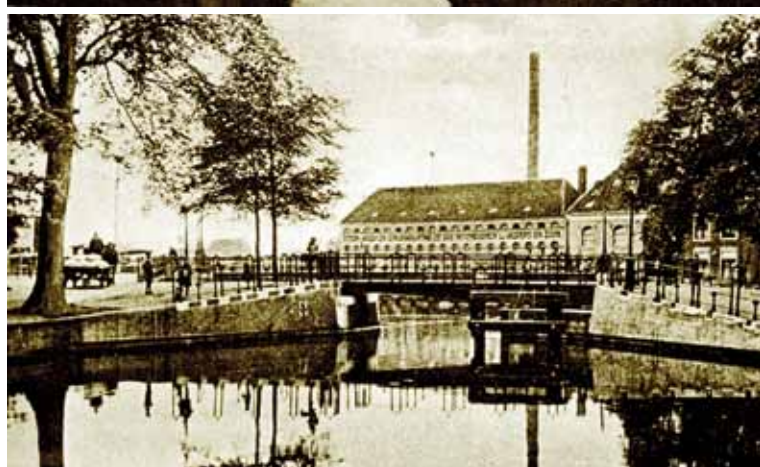
Van boven naar beneden: Uiterste Brug in 1902; de brug in oude glorie. Noodgodsbrug in 1920, nog uitgevoerd als dubbele basculebrug. Turfbrug in 1900. Regentessebrug in 1902 als ongelijkarmige draaibrug.