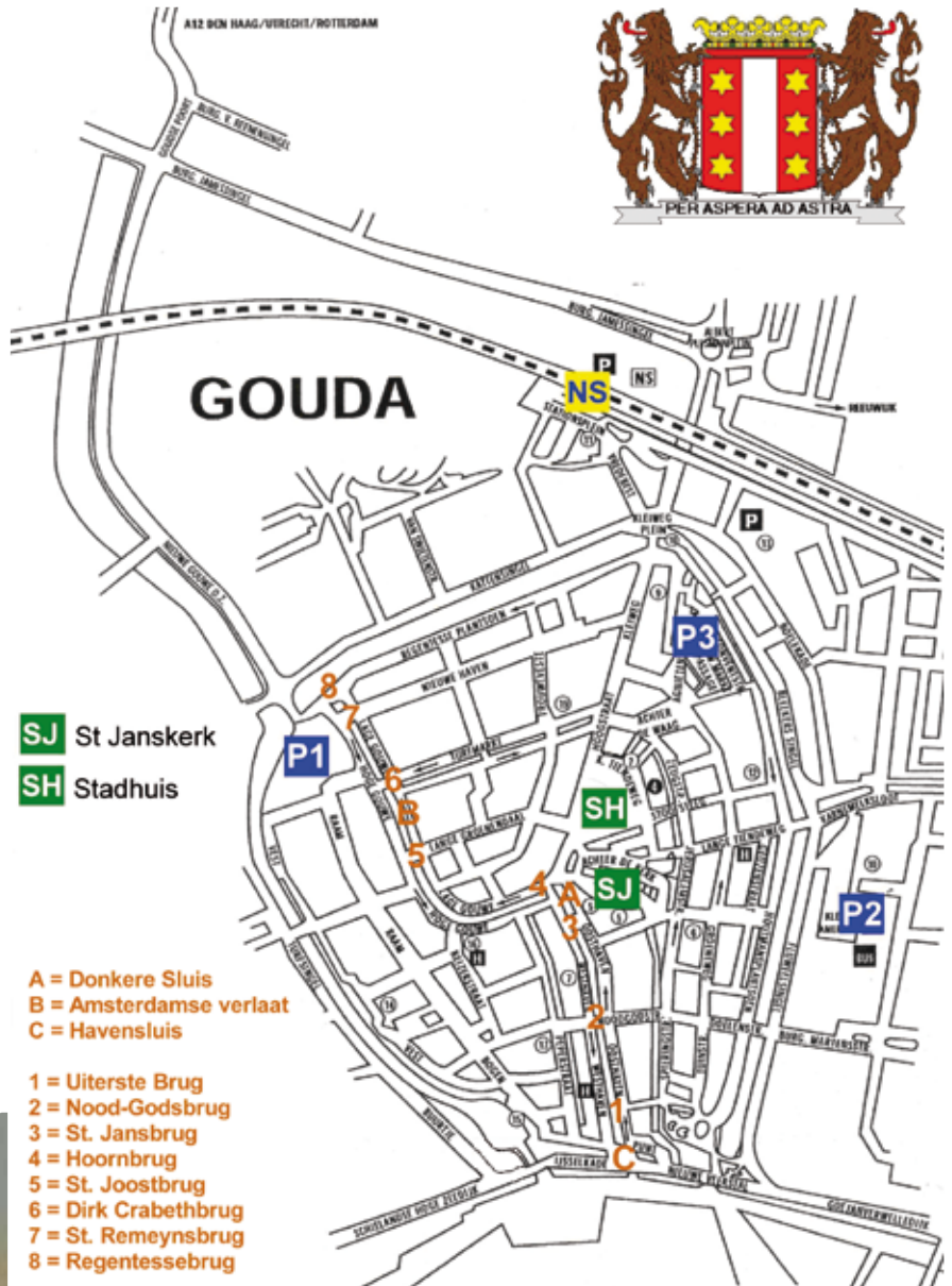
uiterst boven: Hoornbrug boven: De Vischbrug als trappenbrug tussen de visbanken met daarachter de Hoornbrug, een hoge stenen gewelfbrug (18de eeuw). rechts: Overzicht bruggen over de Haven en de Binnengouwwe. onder: De Haven met op de achtergrond de Uiterste Brug in de 18de eeuw.