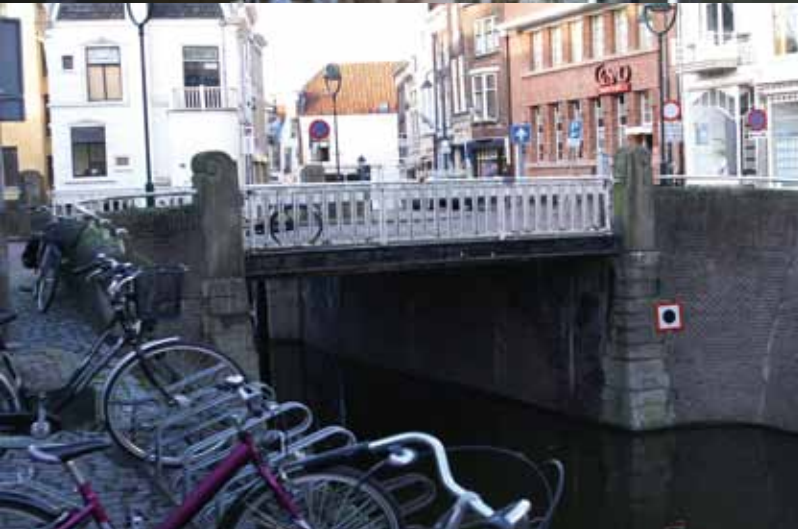
Boven: Hoornbrug onder: St. Jansbrug

dient te worden door een beweegbare brug. De beide Amsterdamse Schoolbruggen, de St. Jansbrug en de Noodgodsbuig, kunnen gezien hun hoge ligging boven het water als vaste brug gehandhaafd blijven.