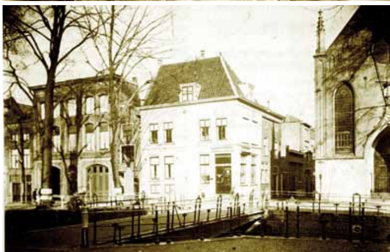
van boven naar beneden: Dirck Crabethbrug 1910.