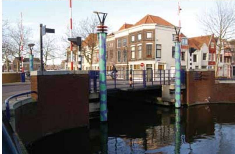
Boven: St. Joostbrug onder: St. Remijnsbrug

De constructiehoogte van het val is zo klein mogelijk gehouden: 0,30 meter. In gesloten stand heeft brug een doorvaarthoogte van 1,05 meter. De hydraulische aandrijving bevindt zich in de kelder. Het beweegbare deel van de brug is gebouwd door Slangen Staal BV. De St. Remijnsbrug werd in september 1995 opengesteld. De nieuwe St. Joostbrug is een eigen ontwerp van Slangen Staal BV, aan wie de bouw van de brug was gegund. De brug is uitgevoerd als dubbele klapbrug waarbij de beide delen van het val in gesloten stand niet tegen elkaar steunen. Ook deze brug wordt hydraulisch bewogen. De landhoofden worden daardoor niet belast op spatkrachten, maar door de uitkraging van het val ontstaan wel grote buigkrachten bij de oplegging. De St. Joostbrug werd in 1999 in gebruik genomen.