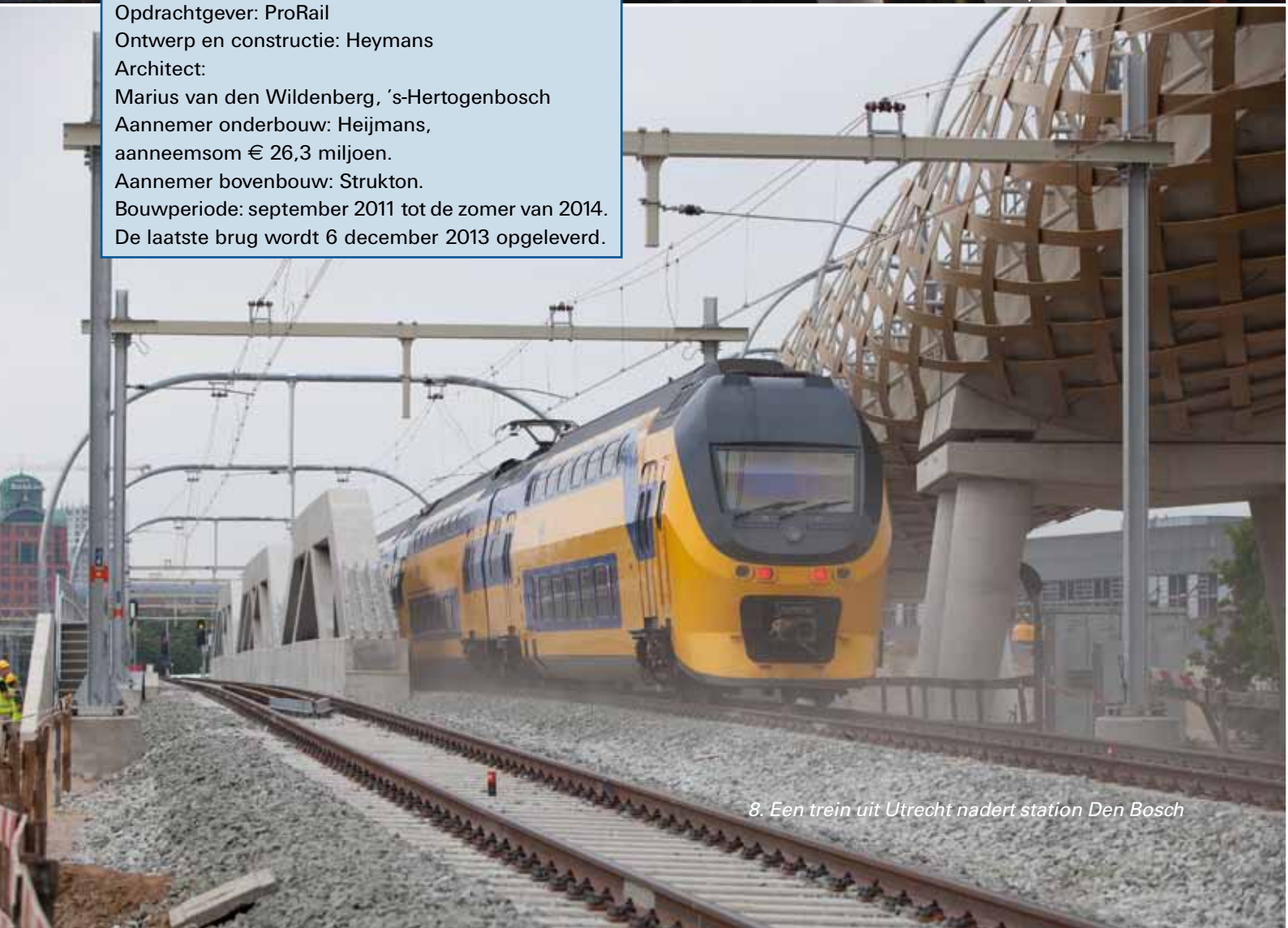
8. Een trein uit Utrecht nadert station Den Bosch