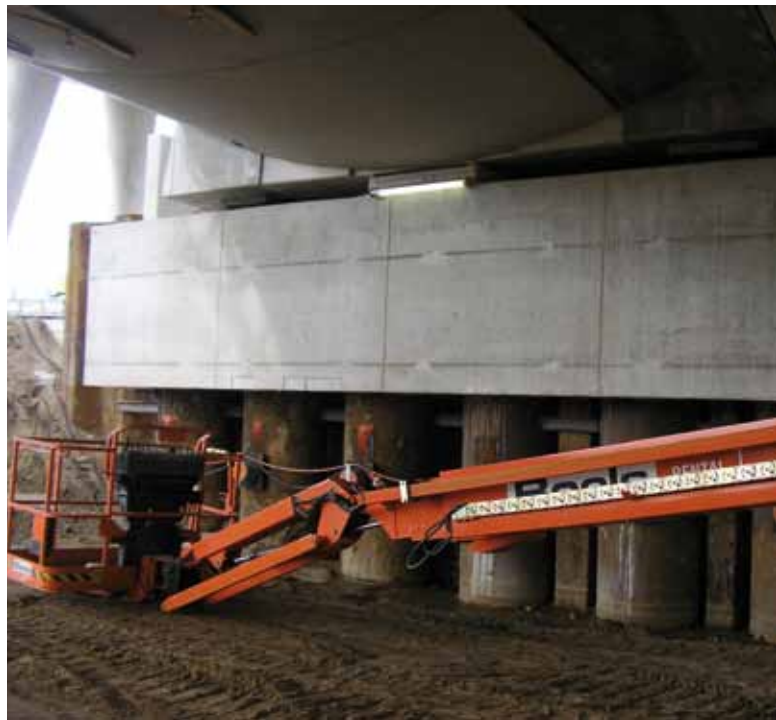
6. Gedeelte van een sloof van een van de landhoofden

Zowel de fly-over als de beide bruggen rusten op ondersteuningsconstructies bestaande uit tafels die op vier kolommen rusten (foto 8). Er zijn 44 ronde, in doorsnee verlopende kolommen op de bouwplaats geprefabriceerd in twee 'tenten'. De beide stalen kolomkisten werden daartoe afgedekt met tentdoek om ook in de winter onder geconditioneerde omstandigheden te kunnen doorwerken. Vanwege de stand van de kolommen in het