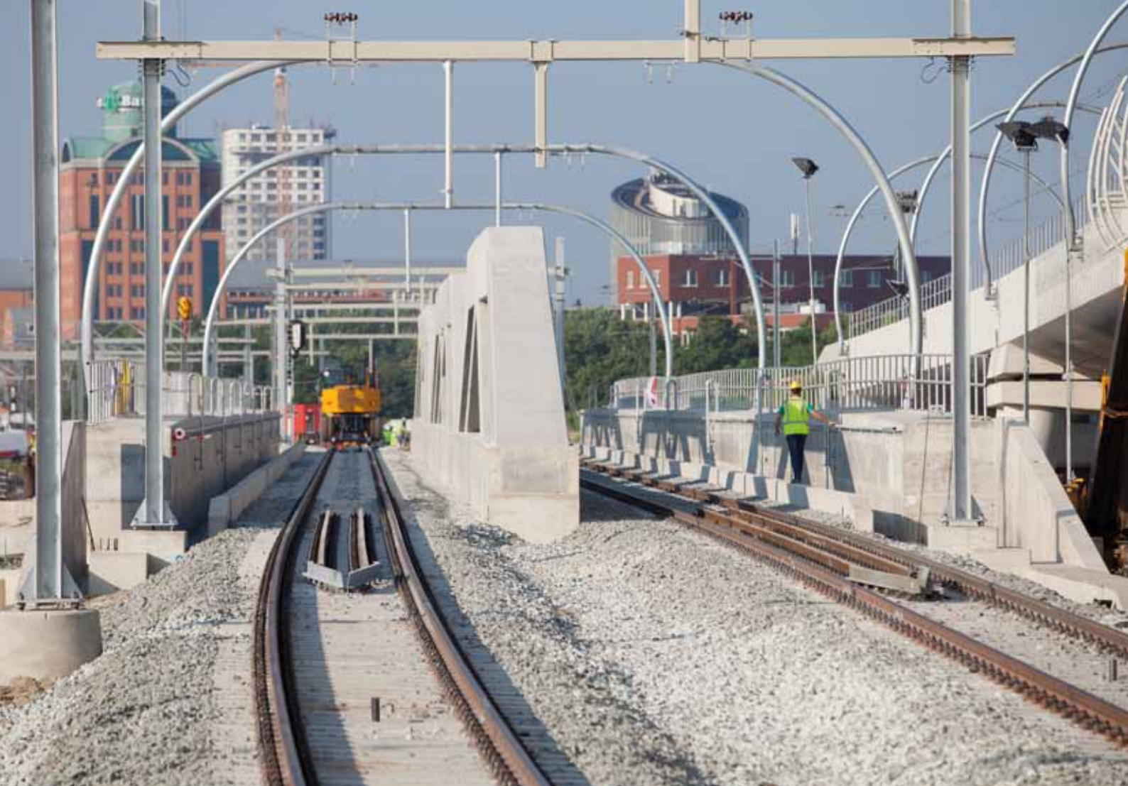
5. Dwarsdoorsnede DS brug (onder) en realisatie (boven)