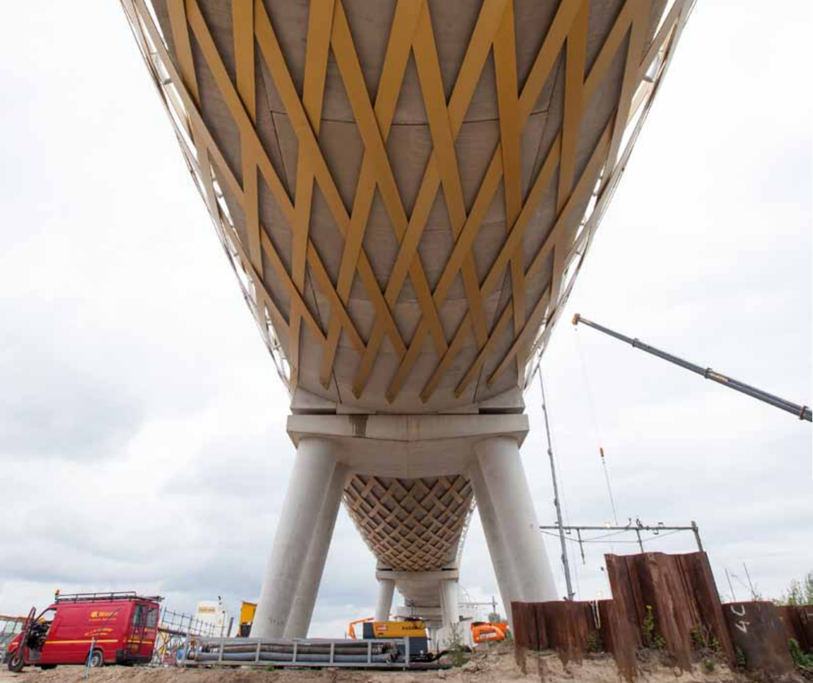
2. Versiering van de bruggen met kruisende aluminium planken, de 'netkous' (boven) en dwarsdoorsnede ES brug (onder)