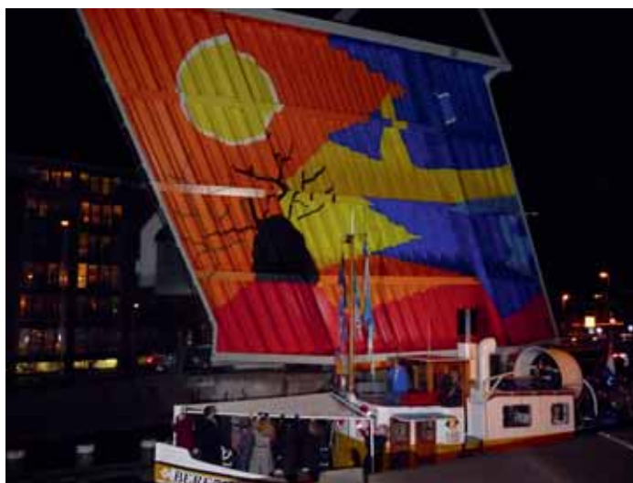
↑ → Opening van de brug in 2011. De schildering is zichtbaar vanaf de Antoniestraat/Burgwal wanneer De Verfroller zich opent voor passerende schepen