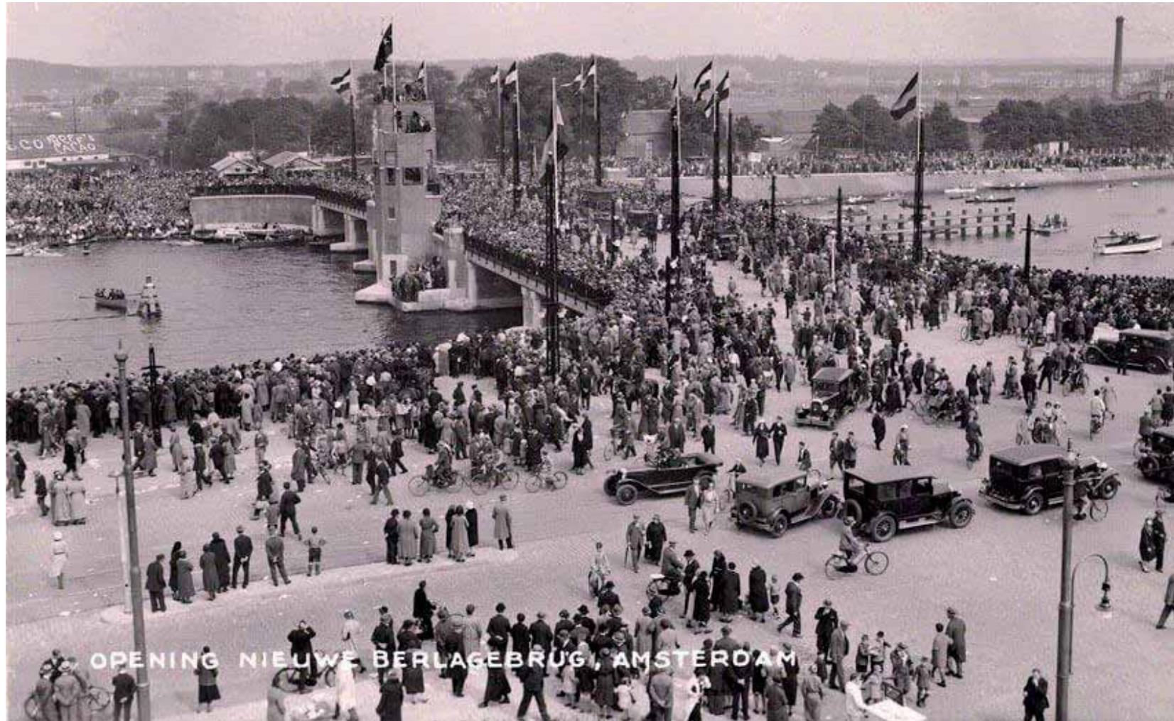
De opening van de brug in 1932