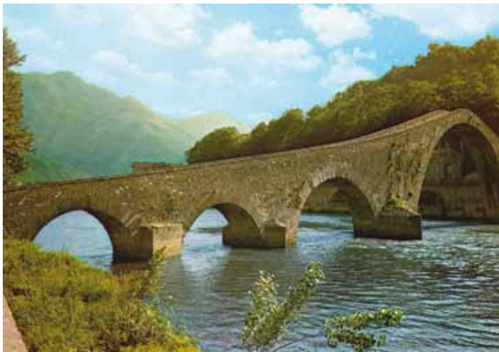
Ponte del Diavolo Borgo a Mozzano bij LUCCA, Italië.

Het betreft een brug waar keizer Augustus in het jaar 14 na Chr. aan begon, en die door zijn zoon Tiberius in 21 na Chr. voltooid werd. Deze brug bestaat nog, en is een fraai voorbeeld van oud-Romeinse bouwkunst.