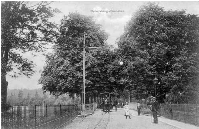
Duivelsbrug in Ginneken, Nederland.