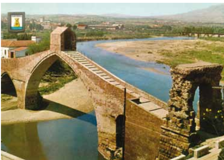
Pont del Diable in Martorell, Spanje.