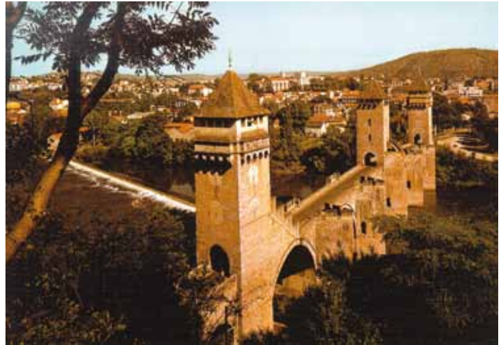
Le pont Valentré, Cahors in Frankrijk

De bouw ervan ging echter met grote moeilijkheden gepaard. Telkens, zo luidt de legende, als er een nieuw stuk klaar was stortte het in. Maar de onmacht om de brug te maken wierp een schaduw over de roem van de keizer. De hulp van de goden werd ingeroepen, maar toen dat niet hielp, bleef alleen de duivel over om te helpen. Maar, Tiberius moest daartoe wel een verbond met de duivel aangaan. Dat hield in dat van het eerste levende wezen dat over de gerede brug zou lopen, de ziel aan de duivel zou toebehoren. Toen de brug echter klaar was, weigerde Tiberius dit. De duivel was hierover zo woedend, dat hij de brug weer wilde vernielen. Maar dat ging niet, omdat hij hem zelf gebouwd had! Er bleef hem niets anders over dan woedend te vertrekken. En heden ten dage zijn z'n voetsporen nog te zien in