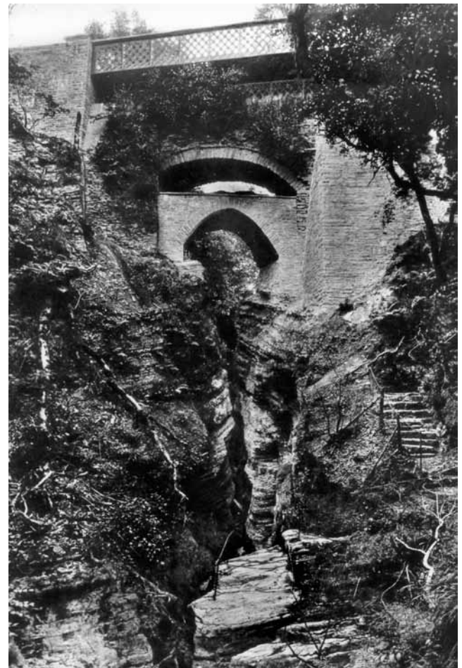
Devils bridge in Aberystwyth in Wales.

De bouw ervan ging echter met grote moeilijkheden gepaard. Telkens, zo luidt de legende, als er een nieuw stuk klaar was stortte het in. Maar de onmacht om de brug te maken wierp een schaduw over de roem van de keizer. De hulp van de goden werd ingeroepen, maar toen dat niet hielp, bleef alleen de duivel over om te helpen. Maar, Tiberius moest daartoe wel een verbond met de duivel aangaan. Dat hield in dat van het eerste levende wezen dat over de gerede brug zou lopen, de ziel aan de duivel zou toebehoren. Toen de brug echter klaar was, weigerde Tiberius dit. De duivel was hierover zo woedend, dat hij de brug weer wilde vernielen. Maar dat ging niet, omdat hij hem zelf gebouwd had! Er bleef hem niets anders over dan woedend te vertrekken. En heden ten dage zijn z'n voetsporen nog te zien in