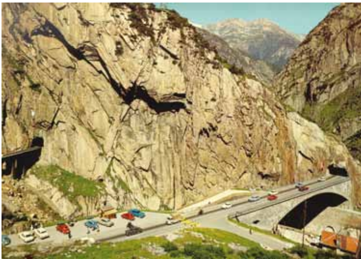
Teufelsbrücke in der Schöllenschlucht, Duitsland. duivelsbruggen.

Elk van de ons omringende landen heeft hier wel voorbeelden van. En bij sommige van deze bruggen was het wonder van de prestatie zo groot, dat men geloofde dat het geen mensenwerk was, maar dat de duivel een handje geholpen zou hebben. In die tijd was men veel meer omgeven door mysteries, veroorzaakt door hogere machten. Toen ontstonden dan ook de legendes van de