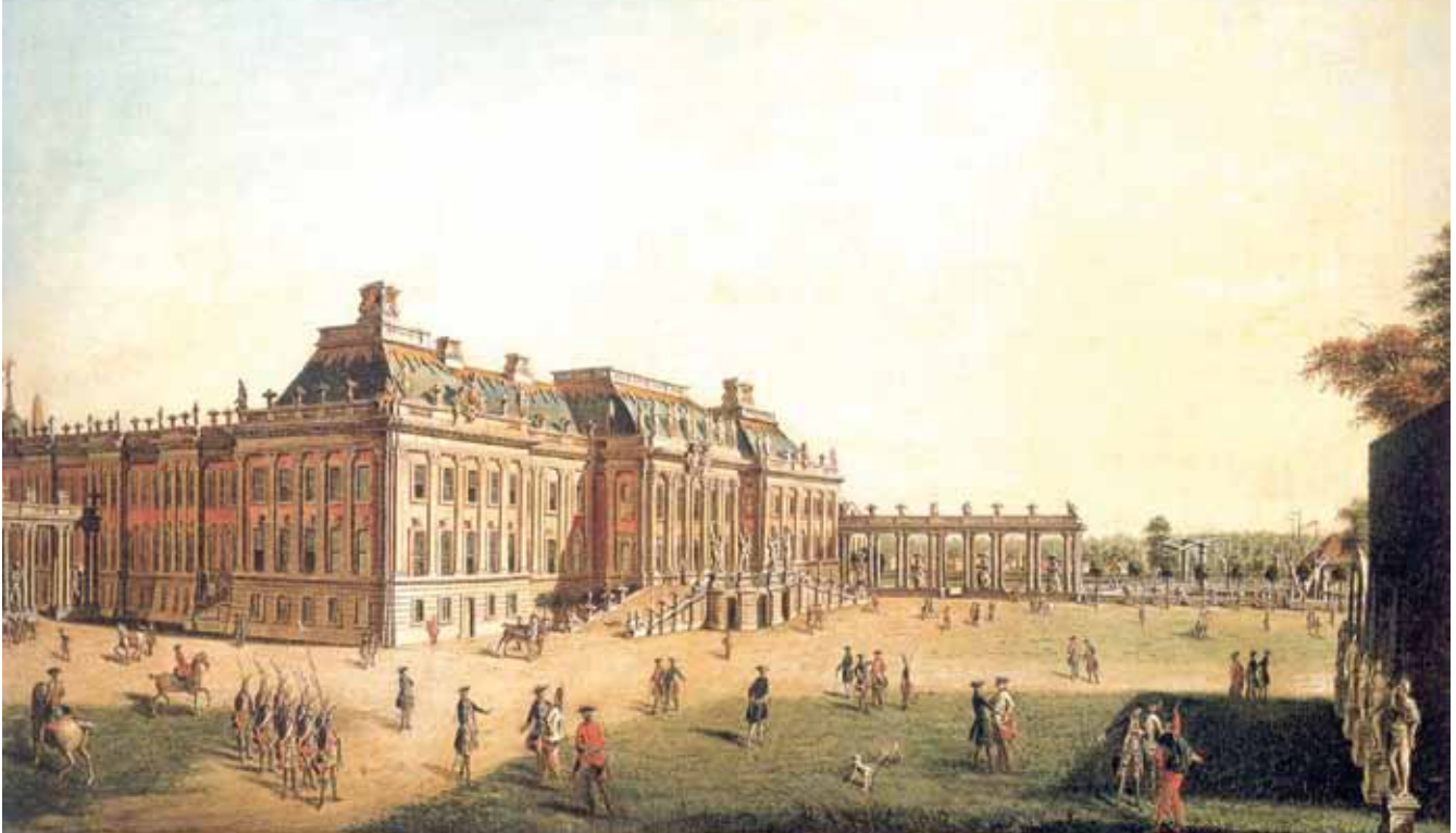
Stadtschloss Potsdam achttiende eeuw In bezit van de 'Stiftung Preussische Schlösser und Gärten Berlin Brandenburg, Gemäldegalerie Potsdam'. Foto rechts: Portret van Frederik Willem, Keurvorst van Brandenburg, Hertog van Pruisen en zijn echtgenote Louise Henriëtte van Nassau, door Gerrit van Honthorst, ca. 1640-1650