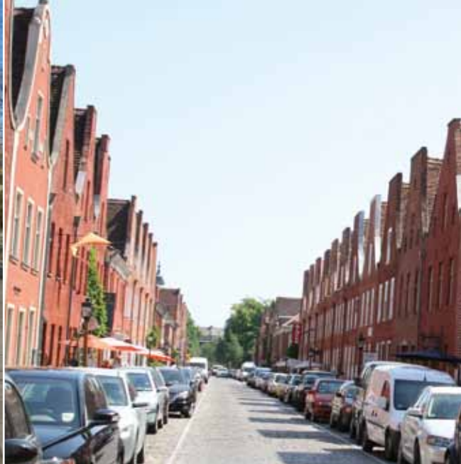
foto's v.l.n.r.: De huidige Lange Brücke Holländische Viertel, Breite Brücke over Stadtkanal voor de Tweede Wereldoorlog, Inzet: Gereconstrueerd Stadtkanal

deze waterweg laten zien. Meegevoerd zand en afzetting door de langzame stroming zorgden voor het ontstaan van eilandjes en zandbanken. Hierdoor ontstonden de huidige landschapsvormen, het 'Freundschaftsinsel' en twee rivierarmen.