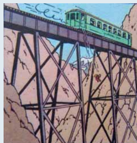
↑ ↗ → 'De brug van Kuifje', 'Kuifje en de Zonnetempel', p. 15.

Na het verschijnen van het album 'De Blauwe Lotus' in 1936 liet Hergé het vrije tekenen los en begon er een ware zoektocht naar bestaand en werkelijk beeldmateriaal als leidraad voor zijn tekeningen. Hij koos in zijn perfectionisme voor een realistisch decor. Auto's werden getrouw afgebeeld, wapens werden overgenomen uit catalogi van wapenfabrikanten, camera's werden nagetekend van een Leica-advertentie, kleding uit modebladen, havens en stadsgezichten van aanzichtkaarten enz. Zijn abonnementen op 'National Geographic Magazine' en 'Paris Match' waren hem daarbij eveneens zeer behulpzaam.