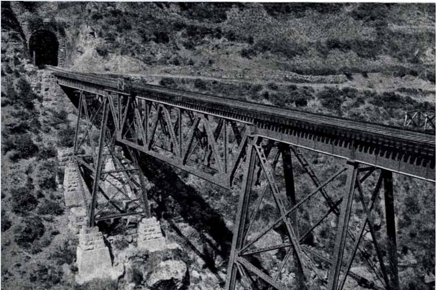
← ↑ De 'Puente Copa' (foto uit 1921).

Generaties zijn er mee opgegroeid, met de Avonturen van Kuifje. Wie kent niet de frisgekuifde reporter met zijn hond Bobbie, zijn vrienden kapitein Haddock, professor Zonnebloem en de detectives Jansen en Janssen? Minder bekend is de werkmethode van geestelijk vader Hergé, die in de aanloop naar een nieuw album zeer gedegen onderzoek deed naar bron en beeld. Zo ook naar een wel heel specifieke brug.