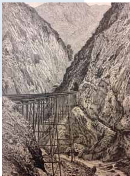
→ 'De brug van Wiener', de oude Puente Chaupichaca, in: Ch. Wiener, 'Pérou et Bolivie. Récit de voyage (...) ouvrage contenant plus de 1100 gravures, 27 cartes en 18 plans', Paris 1880, p. 455.