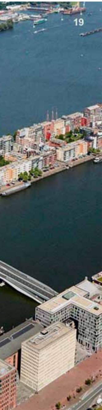
Artist impressie van de toekomstige brug over het IJ, vanaf het Java-eiland in Oost. (illustratie Dijkstra en Venhoeven)

In 2020 wordt nog een besluit genomen over een kleinere brug over het Noord-Hollandsch Kanaal en een brug meer westelijk: vanaf Het Stenen Hoofd over het IJ naar Amsterdam-Noord. In de tussentijd gaan er meer ponten varen over het IJ.