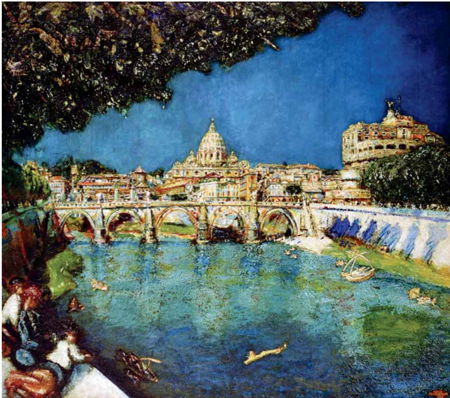
1 Pont Sant'Angelo te Rome, 1934, olieverf op doek, Collectie Stichting Martin Monnickendam. Opvallend is het rijke kleurenpalet en de pasteuze manier waarop de verf is aangebracht.