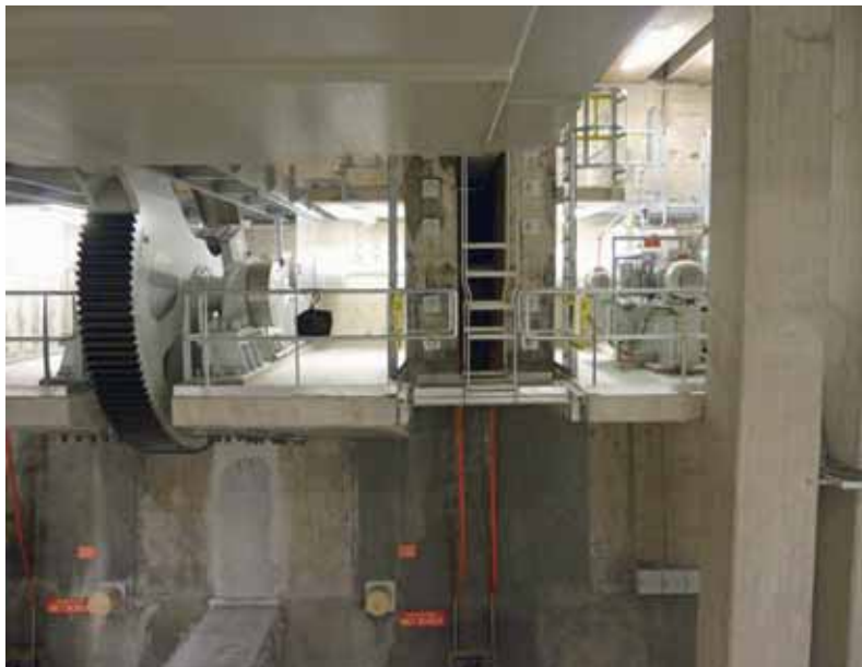
De basculekelder met het nieuwe panamawiel na de renovatie in 2013.

Wegenwiki Flevoland Erfgoed www.delpher.nl www.isdebrugopen.nl Onderzoeksraad voor de veiligheid Rijkswaterstaat Midden Nederland