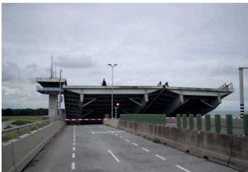
Over de 32,5 meter brede brug ligt aan de oostzijde ook een parallelweg voor langzaam en lokaal verkeer. Dat heeft er toe geleid dat de twee brugklappen een ongelijke breedte hebben.