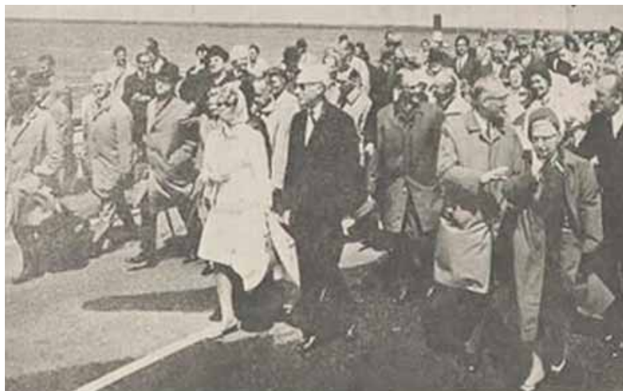
Minister Bakker (vooraan in het midden) en zijn gevolg tijdens de opening van de brug