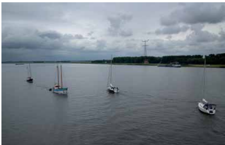
Het Ketelmeer met zeiljachten die wachten tot de boten vanaf het IJsselmeer de brugopening gepasseerd zijn. De 18 m brede doorvaartopening kent eenrichtingverkeer.