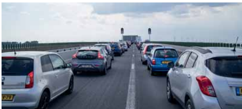
Op drukke zomerse dagen wanneer de brug twee keer per uur opent, staat er al gauw een file van twee km aan weerszijden van de brug over twee rijstroken.