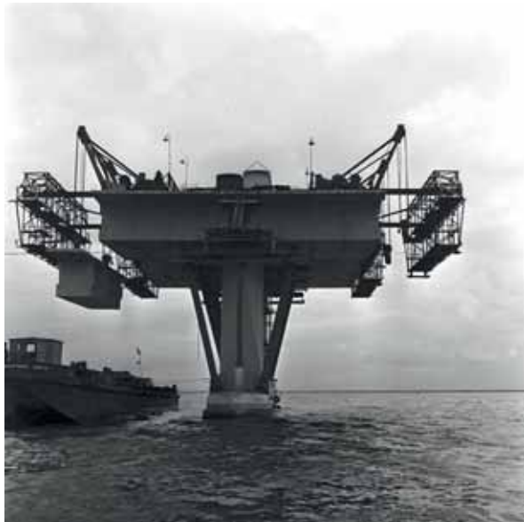
Een van de tien pijlers in aanbouw.