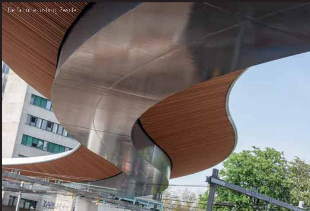
De Schuttebusbrug Zwolle