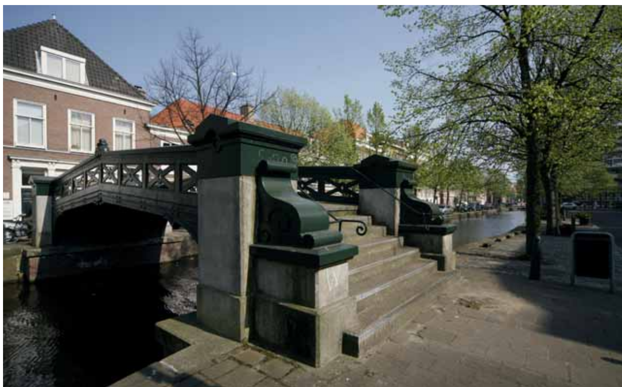
5.a De Haagse brug bij de Boomsluiterskade, opgang tot de brug.