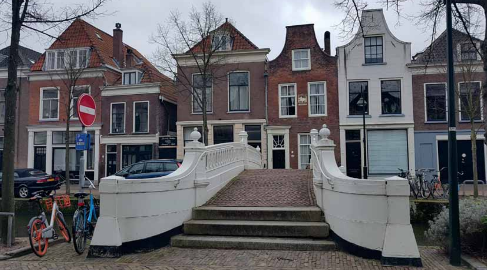
3 Opgang tot de Visbrug, vanuit het noordoosten.

verdenking van spionage gevangen genomen en zat een tiental dagen in Uganda vast. Vlak vóór de val van Idi Amin werd hij het land uitgezet naar Kenya. Uiteindelijk trok hij van Kenya dwars door de Sudan en Egypte terug naar Europa om in Parijs zijn vrouw Catherine te ontmoeten.