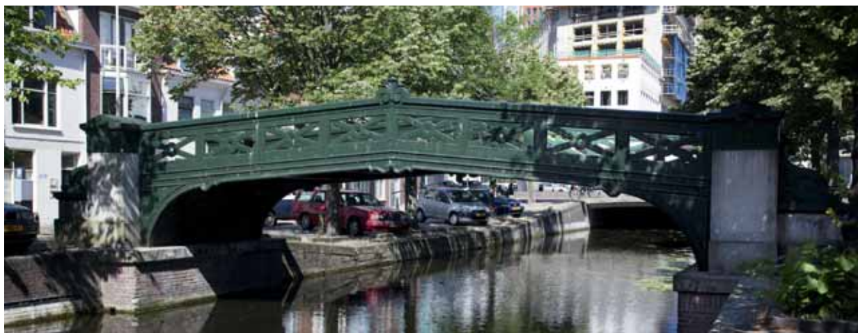
5.b. De Haagse brug, zij aanzicht.