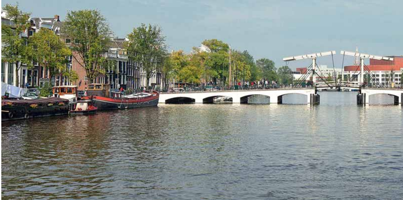
1 Magere Brug (brugnr. 242) in 2021.

In de serie 'Bruggen in de Kunst' dit keer misschien wel de bekendste brug van Nederland: de Magere Brug over de Amsterdamse Amstel. Otto Schilling en Antoon Erfteemeijer schilderden de brug op 14 juli 2012 vanuit een hoekhuis aan de Kerkstraat, tegelijkertijd en naast elkaar zittend.