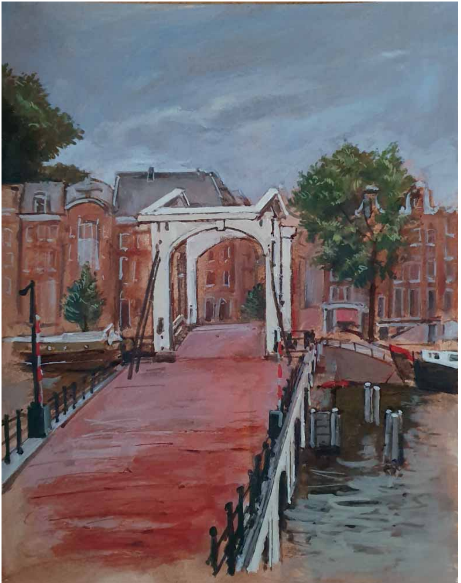
3 Magere Brug, Otto Schilling, aquarel, 2021 Coll. Schilling.