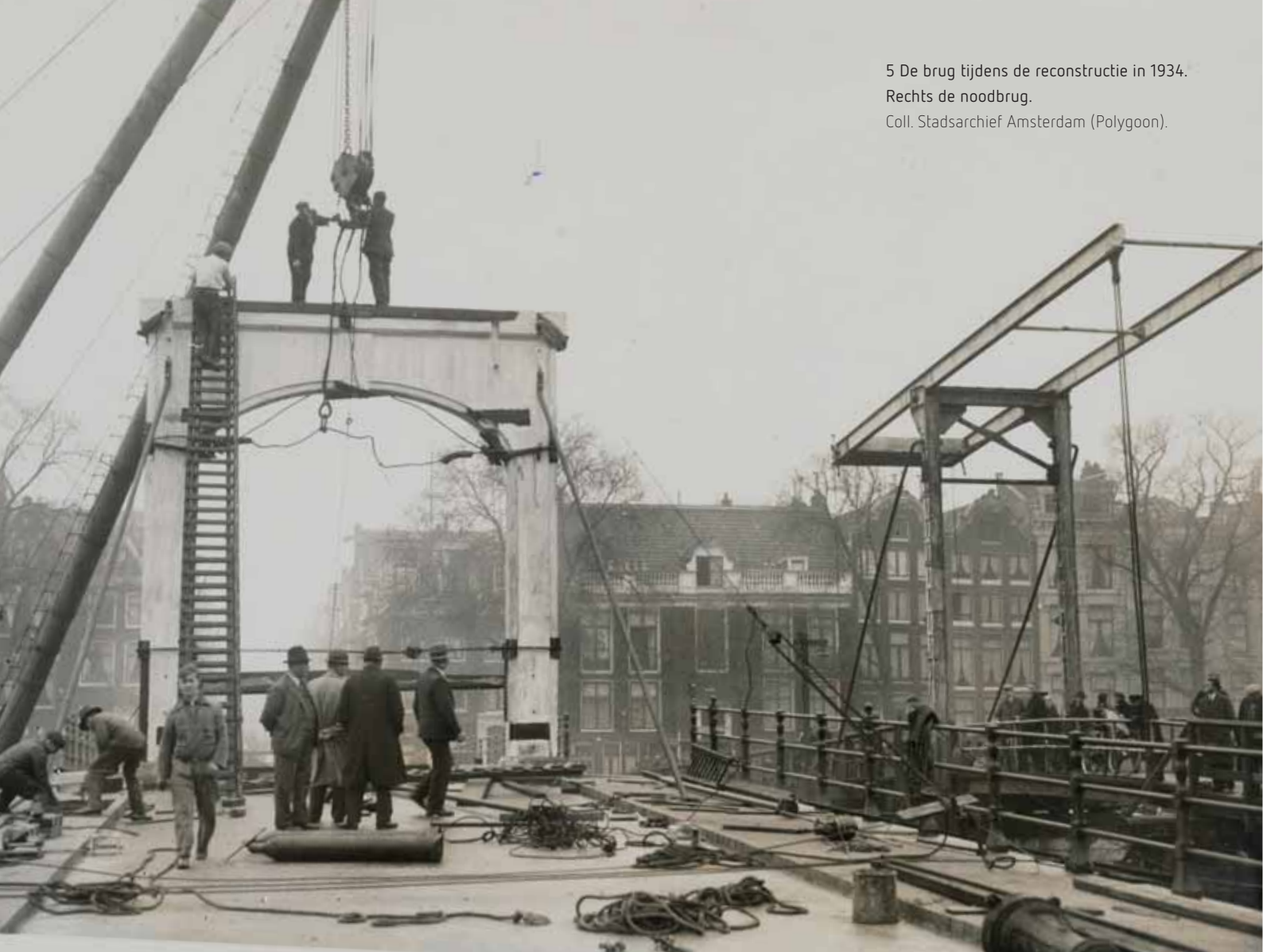
5 De brug tijdens de reconstructie in 1934. Rechts de noodbrug.