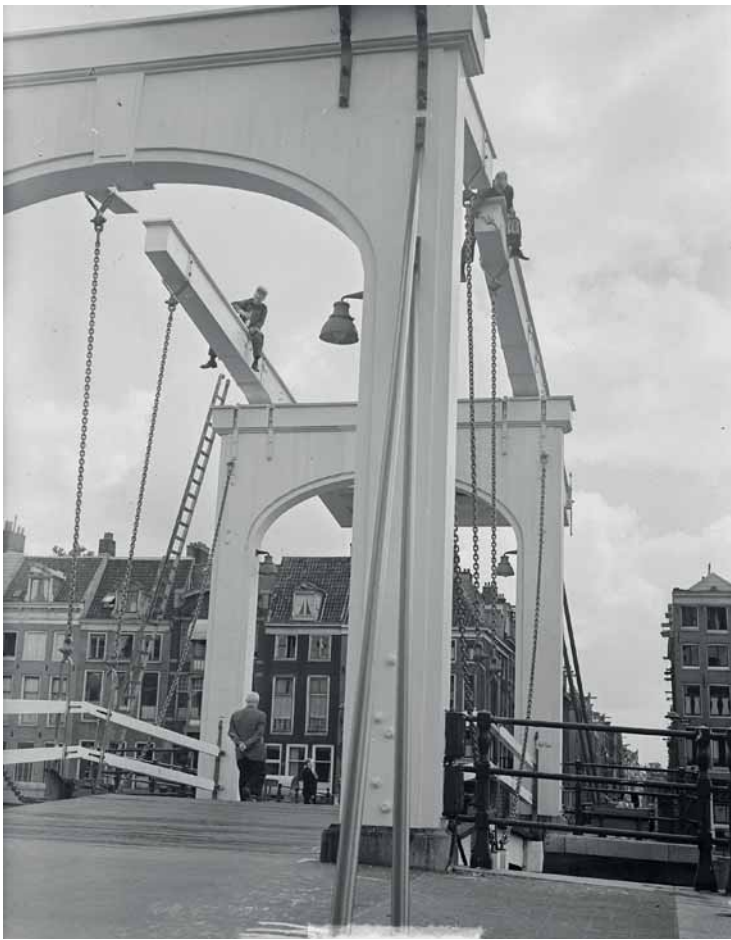
6 Onderhoud aan de brug in 1949, Coll. Nationaal Archief, fotograaf J.D. Noske.

In 1840 kwam er bij een renovatie een dubbele ophaalbrug in het midden; inmiddels passeerden ook rijtuigen de brug. Dertig jaar later bracht men het aantal doorvaartopeningen terug tot negen.