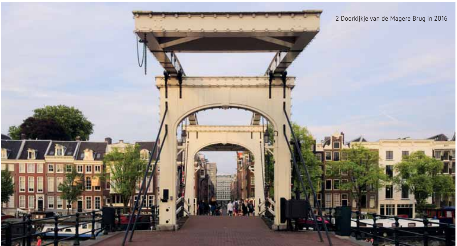
2 Doorkijkje van de Magere Brug in 2016

De brug wordt 'mager' genoemd vanwege haar smalheid, maar misschien werd deze notie nog versterkt door de aanvankelijk veel bredere stenen brug die hier tijdens de vierde staduitbreiding van 1663 gepland was. Het rampjaar 1672 veroorzaakte echter een economische terugslag waardoor de overkant van de Amstel (Nieuwe Herengracht, Nieuwe Keizersgracht, Nieuwe Prinsengracht) nagenoeg onbebouwd bleef. Toen er einde 17 de eeuw wel wat meer bebouwing kwam, koos men voor een eenvoudiger, goedkoper en smaller alternatief, magerder dus.